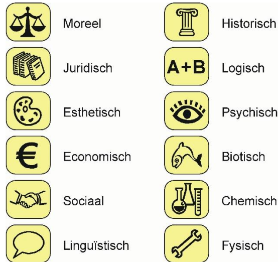
Figuur 2. Twaalf aspecten (vrij naar Herman Dooyeweerd).