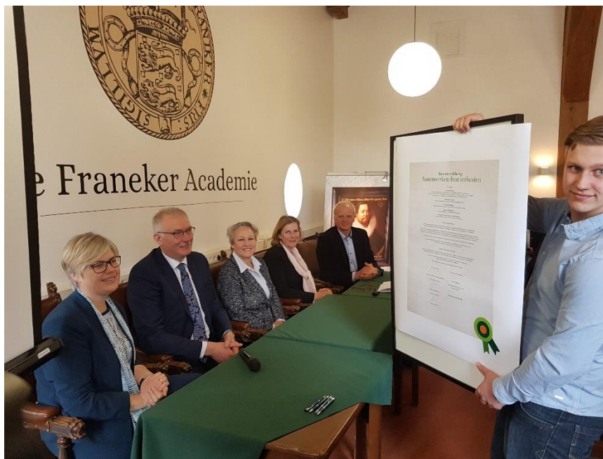
Figuur 3. Het ondertekende document op 23 maart 2018.

De verwachting is dat in het begin relatief kleine projecten in het proces worden betrokken – ‘quick wins’ om ervaring op te doen – en dat geleidelijk de kraan aan het begin wordt opgedraaid, waarbij de complexiteit van de projecten toeneemt. Tegen de tijd dat de Omgevingswet daadwerkelijk in werking treedt, is noordwest Friesland volledig op stoom gekomen. Het implementeren van de wet is namelijk geen doel op zich, maar een steun in de rug van wat we hier zelf graag willen realiseren.