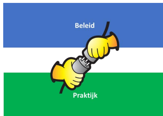
Figuur 1. De stekker waarmee beleid en de praktijk van gebiedsprocessen worden verbonden

De uitvoering van nationale overheidsprogramma's is vaak gebiedsgericht. Dit is om onder andere de betrokkenheid van burgers en bedrijven te vergroten. Een voorbeeld hiervan is het NPLG (Nationaal Programma Landelijk Gebied). Deze gebiedsaanpak lijkt vooral gericht te zijn op het realiseren van de eigen programmadoelstellingen. Tegelijkertijd is er een veelheid aan lokale initiatieven die zich niet verbonden weten met deze overheidsprogramma's, maar wel een bijdrage kunnen leveren en zich verder kunnen ontwikkelen.